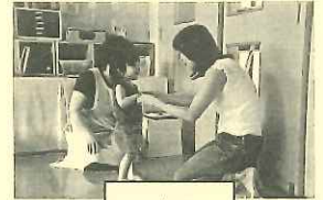
いってらっしゃい