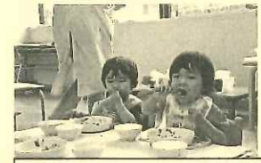
みんなでたべるとおいしいね!