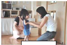
いってらっしゃい